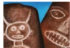
Ground Zero - Scared Ground, 1997