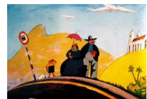
The blue Kingdom 1989

Sein Name steht für den Zeichentrickfilm der brasilianischen Underground-Kultur. Seit 1978 führt er seine eigene Internet- und TV-Produktion und versucht mit seinen Themen für Kinder und seinen wunderbaren Satiren, die Massen zu erreichen.