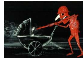
The Chain - The Horrors of War

Obwohl er schon 1973 am Royal College of Arts abschloss, widmet sich Phil Mulloy erst seit 1981 definitiv dem Beruf als Animationskünstler. Fast 20 Jahre arbeitete er für Dokumentarfilme und Fernsehprogramme. Der Sarkasmus und die beißende Schärfe seiner schwarzen Komödien kennen keine Grenze. Die minimalistische Ästhetik, bewusst roh und primitiv, tragen zu dem unverwechselbaren Stil seiner Filme bei, die ihm zahlreiche internationale Preise eingebracht haben.