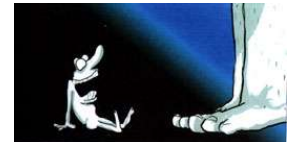
Power Play 2004

Seit 1985 lebt und arbeitet Greg Lawson in Amsterdam. 1991 gründete er dort sein eigenes Animationsstudio, heute ein Anziehungspunkt für viele junge Animationskünstler. Sein "Safesex: The Manual" gewann zahlreiche Preise z.B. in Bologna, San Francisco und Zagreb.