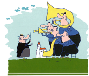
2D or Not 2D – Horns 2002

Nach dem Studium des Grafikdesign und Illustration arbeitete Paul Driessen zunächst in der holländischen Werbeindustrie bevor er seine Karriere als Trickfilmer in Kanada begann. Die Chance seines Lebens bot sich, als er bei dem Beatles-Film "Yellow Submarine" mitarbeiten konnte. Seine eigenen Kurzfilme, die auf Worte verzichten, sind voller Ironie und arbeiten mit einem bitterem zuweilen morbiden Humor. Er lehrt Zeichentrick an der Kunsthochschule in Kassel.