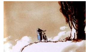
Father and Daughter 2000

Dudok de Wit lebt in London und arbeitet seit 1978 im Bereich Animation und Animationsregie. Er gehörte zum Produktionsteam der Disney Studios für "Die Schöne und das Biest" und "Fantasia 2000". Daneben realisiert er auch seine eigenen freien Filme und illustriert Kinderbücher. 2001 wurde sein Film "Father and Daughter" mit dem Oscar ausgezeichnet.