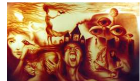
Stones Kövek 2000, Sandanimation