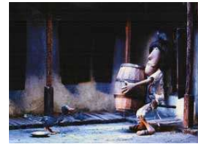
Caribbean Christmas, 2001