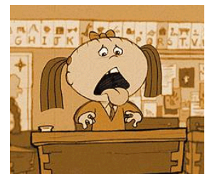
Give up Yer Aul Sin, 2001