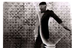
Across the Fields 1992