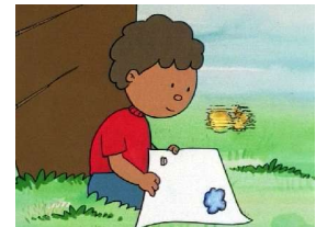
Der Junge und der Vogel, 2004