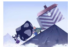
At the Ends of the Earth 1999