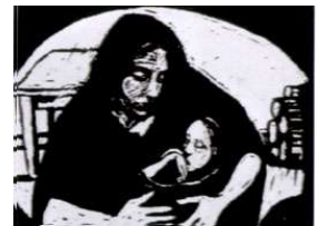
Death and the Mother 1997