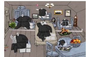
Travel to China ©Gil Alkabetz, Sweet Home Studio, 2002

Nach einem Grafikdesign Studium in Jerusalem arbeitete Alkabetz von 1985 bis 1994 als unabhängiger Trickfilmkünstler in Israel. 1995 führte ihn ein Stipendium nach Stuttgart. 2001 gründete er zusammen mit seiner Frau Nurit Israeli das Sweet Home Studio. Seine Kurzfilme haben international viele Preise gewonnen. Seit 2004 arbeitet er als Professor für Animation an der Hochschule für Film und Fernsehen, Babelsberg.