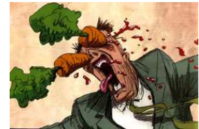
Sex & Violence 1997

Bill Plympton arbeitet als unabhängiger Animationskünstler in New York. Seine bissigen Werke finden international eine große Fangemeinde. 1987 wurde sein Film "Your Face" von der Academy in Hollywood für den OSCAR nominiert. Zuletzt erschien 2004 sein selbstfinanzierter Langspielfilm "Hair High".