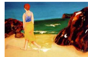
Small Treasures 1995