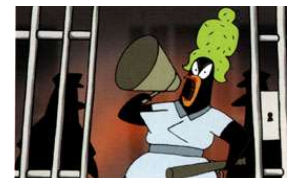
Penguins Behind Bars, 2003