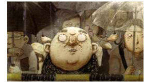
Mt. Head, 2002

Seinen ersten Zeichentrickfilm drehte er mit 13 Jahren. 1993 gründete er dann seine Produktion "Yamamura Animation". Den bisherigen Höhepunkt seiner Laufbahn stellte der große Erfolg von "Mt. Head" dar, mit dem er den Grand Prix in Annecy, Zagreb und Hiroshima gewonnen hat und für den er 2003 mit einer Oscar-Nominierung bedacht wurde.